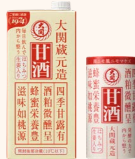
1L紙パック 125mlカートカン詰

蔵元づくりの自社酒粕を使用し、蜂蜜と生姜を隠し味にした、どこか懐かしい味わいの酒粕甘酒です。