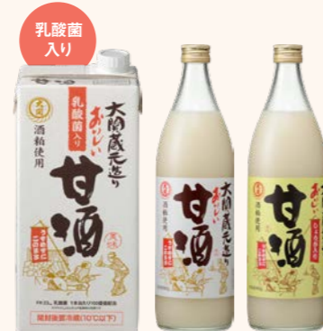
1L紙パック (乳酸菌入り) 940g瓶詰 生姜なし 940g瓶詰 生姜あり

やさしい舌ざわりと、なめらかなのどごしが自慢の甘酒です。蜂蜜をブレンドし、スッカリとした甘みに仕上げています。